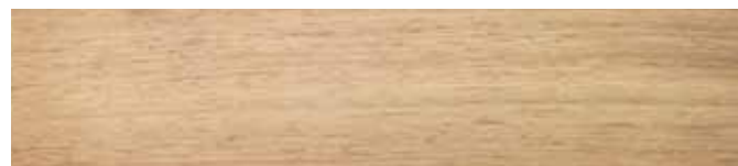
Finitura liscia - Smooth finishing